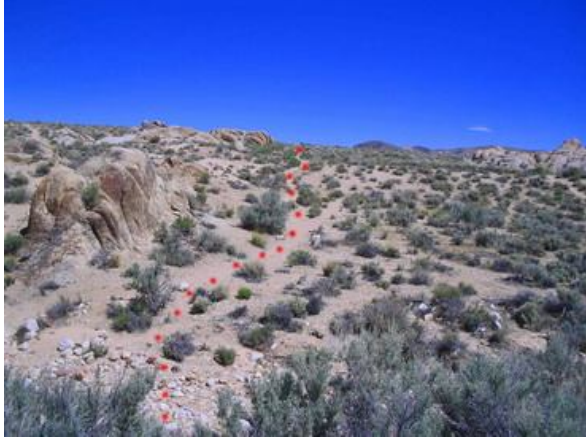
7. Nun verläuft der Trail rechts von der Felsen, in nördlicher Richtung, auf die nächste Felsgruppe zu.