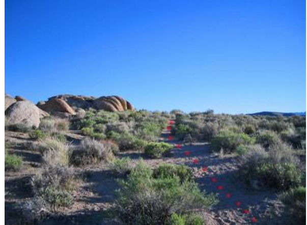
8. Hier sieht man die Felsgruppe aus etwas geringerer Entfernung. Der Trail führt sanft bergauf.